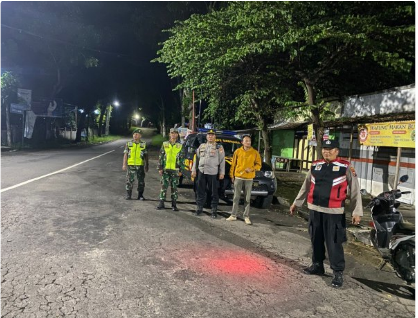
Jelang Tahun Baru 2025, Forkopimca Ngariboyo Gencar Laksanakan Patroli Malam

Magetan. - Personil gabungan dari Posramil Ngariboyo Koramil Tipe B 0804/01 Magetan, Polsek Ngariboyo dan aparat pemerintah Kecamatan Ngariboyo melaksanakan patroli malam hari dalam rangka meningkatkan keamanan yang kondusif pasca Hari Raya Natal dan menjelang Tahun baru yang akan datang.